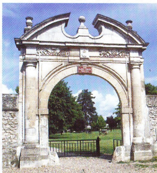
Entrée du parc de Trie-Château