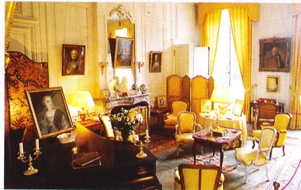
Château de Boury en Vexin

Pour rejoindre Lattainville, prenez la direction de Delincourt, (route principale). A Delincourt prenez Gisors et tournez à gauche avant l'église puis prenez la direction de Lattainville.