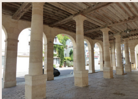
Les halles de La Roche-Guyon

Comité du Val-d'Oise, 01 30 35 81 82, www.cdpr95.com