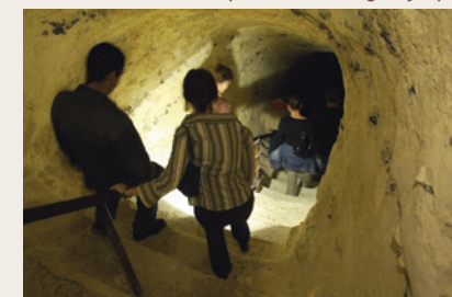
Visite du patrimoine troglodytique

aux écuries du XVIII e siècle, des premières habitations troglodytiques au potager des Lumières, des salons d'apparat aux casemates aménagées par Rommel durant la seconde guerre mondiale.