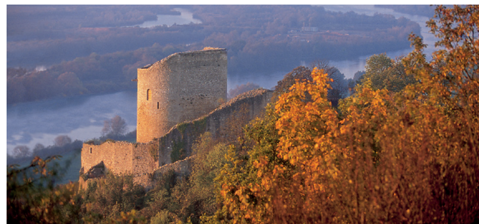
Donjon du château de La Roche-Guyon